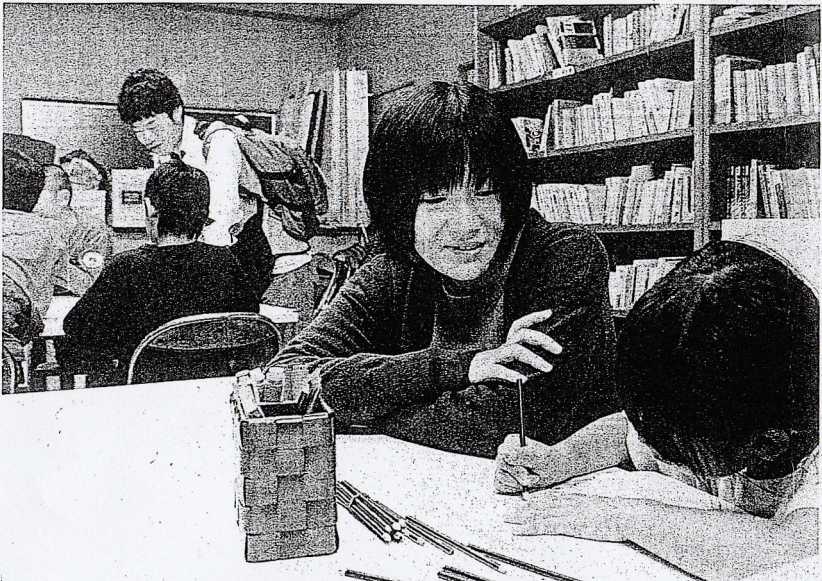
子どもたちに勉強を教える大分大学生 =7日午後、大分市、撮影・鈴木幸一郎

「こんにちは。今日はよろしくね」。11月上旬の午後6時、1年の男女2人が同市敷戸西町の子ども食堂「すみれ学級」を訪れた。この日集まった小・中学生は計18人。宿題を教えた後、同じテーブルを囲んで夕飯を食べ、同8時まで一緒に過ごした。