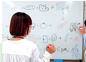
・学習指導員と「絵しりとり」

2021年1月に豊後大野市のスクールソーシャルワーカーと連携し、すみれ学級に来ていない児童・生徒にもささやかであります生理用品の無償配布を開始しました。