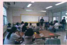
大学生による英会話