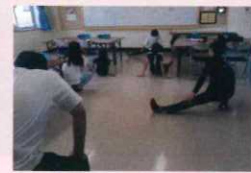
遊んだあとのストレッチ