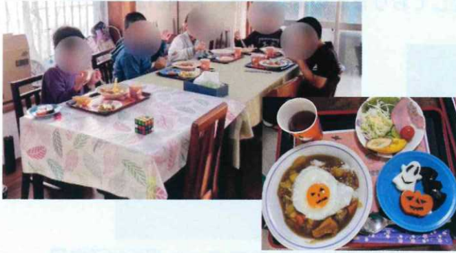
ハロウィンの特別メニュー